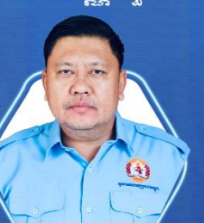
ទីប្រឹក្សាជាន់ខ្ពស់ ឯកឧត្តម ឌី បូរីម៉ា