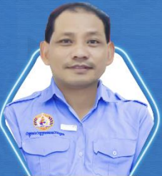
ទីប្រឹក្សាជាន់ខ្ពស់ ឧកញ៉ា ភីន ផល្លា