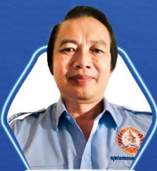
ទីប្រឹក្សាជាន់ខ្ពស់ ឧកញ៉ា ហាង សុគន្ធ