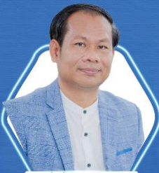
ទីប្រឹក្សាជាន់ខ្ពស់ លោក ភីម ឡឿន