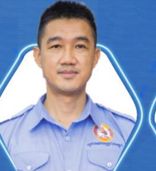
ទីប្រឹក្សាជាន់ខ្ពស់ លោក ស៊ិន ធីន